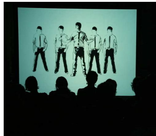
Soirée d'ouverture 2008 - La Bellevilloise

Pour les projections en journées cf chapitre jeune public p.23